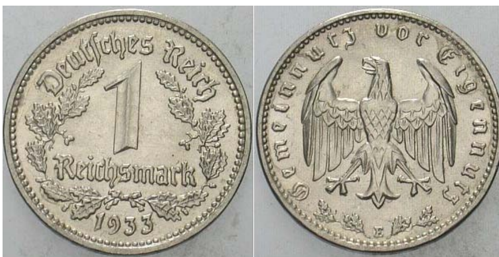
Der Traum vieler AfD-Mitglieder: Die Rückkehr zur alten Deutschen Währung

Wurde Frauke Petry von der US-Regierung einbestellt, um genau diese Fragen innerhalb der AfD abzuwürgen? Ihr gesamtes Herrschaftssystem in der AfD Sachsen beruht auf Unterdrückung, Mobbing und Polit-Terror mit Hilfe der Extremisten von der FREIHEIT. Insofern wäre die Ausführung des US-Mandats lediglich die Fortsetzung ihrer internen Politik mit anderen Themen. Business as usual? Oder soll die stramme Rechtsauslegerin bei der sächsischen Landtagswahl das rechtsextreme Lager spalten? Statt 8% für die NPD dann 4,0% für die AfD und 4,0% für die NPD? Steckt dahinter eine CDU-List? Marschiert Gott-Sei-Bei-Uns-Petry deshalb mit preußischem Stechschritt durch Sachsen?