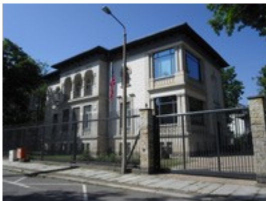
regelmäßiger Treffpunkt zum Lunch US-Konsulat in Leipzig

Bundeskanzlerin verneint das Fehlen der deutschen Souveränität während einer Podiumsdiskussion am 21.08.2013 in Stuttgart.